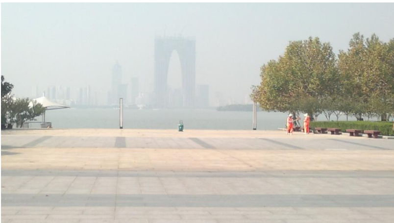
Kuva 4. Miesten housujen mukaan rakenteilla oleva pilvenpiirtäjä.

Tähän kuvassa olevaan järveen oli tehty pari saartakin, koska joku oli sellaiset halunnut.