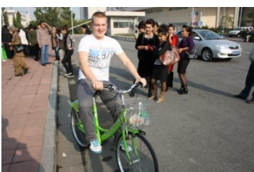
Kuva 5. Valmiina lähtöön.

Tämän jälkeen opiskelijamme pääsivät paikallisten opiskelijoiden kanssa polkupyöräretkelle. Polkupyöräretki meni kuulemma hyvin, mutta välillä liikenne oli pelottanut opiskelijoitamme.