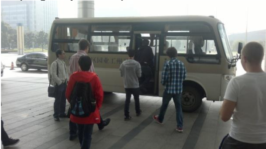
Kuva 1. Auto jolla liikuimme useasti.

Levättyämme kiertelimme kampuksen paikkoja läpi. Näimme missä on ruokalat, urheilukenttä, liikuntasa- lit, pingis-, ja sulkapallokentät.