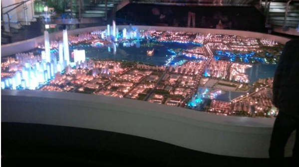
Kuva 3. Industrial Parkin pienoismalli

Meille esiteltiin Industrial Parkin yhteistyökumppanit ja alueen ”pienoismalli”.