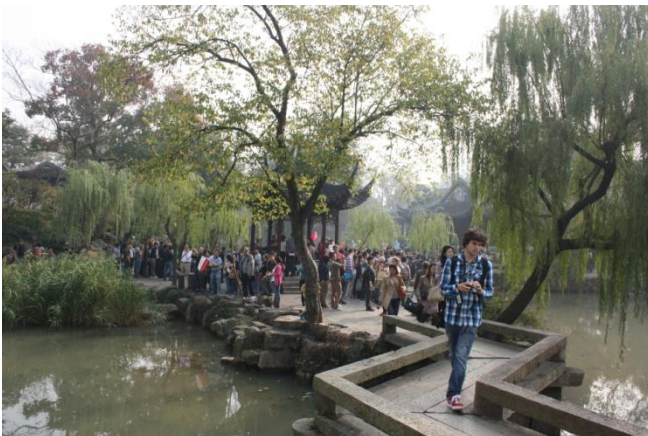
Kuva 9. Vaatimattoman virkamiehen puisto

Meidät viedään paikalliseen puistoon, jonka nimi oli vaatimattoman virkamiehen puisto. Erittäin hieno paikka ja täällä näkyi muitakin länsimaisia ihmisiä. Ainakin hollantilaisia näytti olevan liikkeellä.