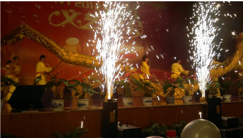
Kuva 14. Uusien opiskelijoiden avajaistilaisuudessa kipinät sylissä.