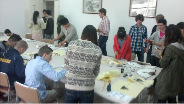
Kuva 13. Maalausta paikallisten opastamana.