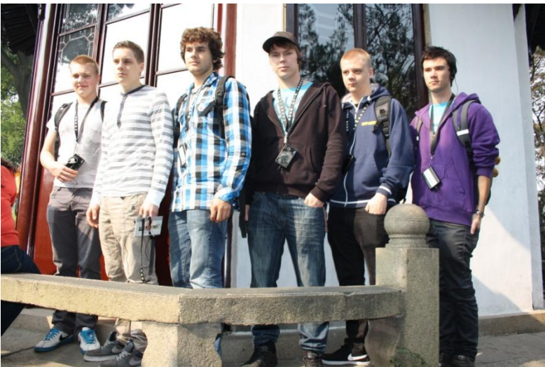
Kuva15. Suomalaiset opiskelijat vaatimattoman virkamiehen puistossa.