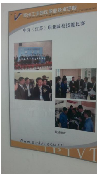
Kuva 2. Käytävällä oleva taulu Kiina-Suomi -mekatroniikkakilpailuista.

Seuraavaksi käytävällä tuli vastaan taulu, jossa oli tutun näköisiä ihmisiä. Taulussa oli kuvia Kiina-Suomi -mekatroniikan maaottelukilpailuista ja tapahtuman palkintojenjaosta.