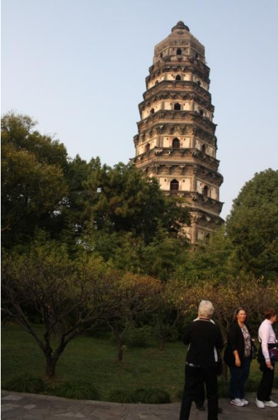
Kuva 10. Tiger Hill

Vierailimme myös Suzhoun paikallisessa museossa.