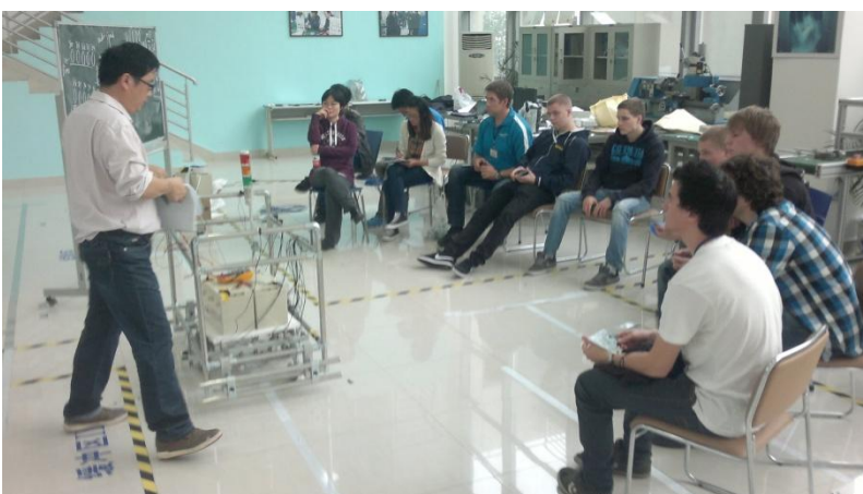
Kuva 7. Kiinalaisen opettajan luento aiheesta.