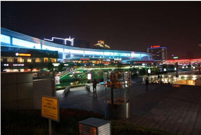
Kuva 12. Time Squaren 500 metriä pitkä sky-screen

Tämän jälkeen Wiklundin taulutelevisio näyttää melkoisen hupaisalta.