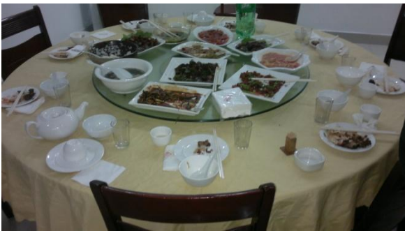
Kuva 8. Perinteinen kiinalainen kattaus, jossa keskellä on pyörivä lasinen pöytä.

Katseita tulee melko paljon, koska oma habitukseni on hieman poikkeava paikallisiin nähden.