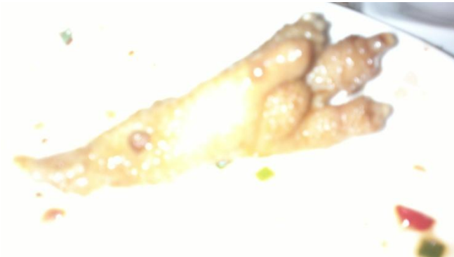
Kuva 11. Ankkaparan jalka.

Käymme syömässä kiinalaisten oppaidemme kanssa ja taas kerran ruoka on erinomaista. Kaikki suomalaiset syövät erittäin hyvin ja ennakkoluulottomasti. Kovimman kulinaristimme ilme hieman värähtää, kun ankkakeitosta tulee omalle lautaselle ankan pää. Itselläni käy parempi onni ja saan pelkän jalan.