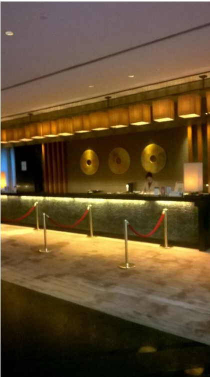
Worldhotel Grand Dushulaken vastaanotto.

nimenomaan työssäoppimisen näkökulmasta. Näkisin, että jatkossa voisimme yrittää saada merkonomiopiskelijoita myös Worldhotelliin työssäoppimaan.