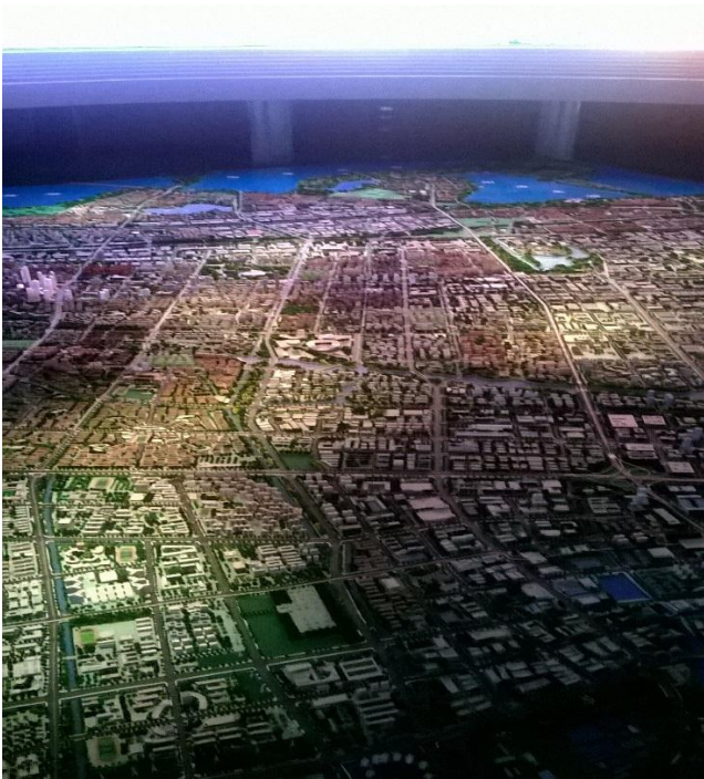
Kaupunkisuunnittelukeskus ja pienoismalli Suzhousta.

Matkan sisältöön ei tullut muutoksia, vierailimme ensimmäisten päivien aikana kaupunkisuunnittelukeskuksessa, Suzhoun vanhassa keskustassa sekä työssäoppipaikoilla, eli SIPIVT International officessa, SuiShenWan–peilyrityksessä sekä Worldhotel Grand Dushulake –hotellissa. Tämän lisäksi kiinalaiset opiskelijat pitivät meille oppitunnin kiinalaisesta kulttuurista, pääsimme myös seuraamaan oppilaitoksessa järjestettyä juhlaa.